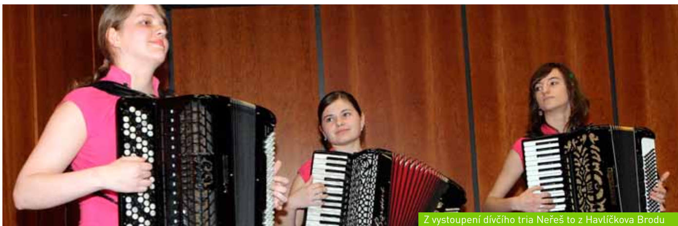
Z vystoupení dívčího tria Neřeš to z Havlíčkova Brodu (Slavnostní setkání knihoven obcí Jihomoravského kraje)

Více na: mzk.cz/SlavnostniSetkaniKnihoven-JMK2012 .