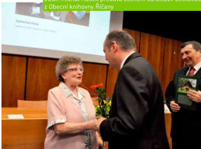
JUDr. Michal Hašek na Slavnostním setkání knihoven obcí Jihomoravského kraje