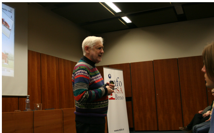
Paul Von Blum v Moravské zemské knihovně

Nově se podařilo navázat kontakt s organizací CTYOnline, která umožňuje zapojení nadaných žáků do výuky Centra pro talentovanou mládež americké university Johns Hopkins.