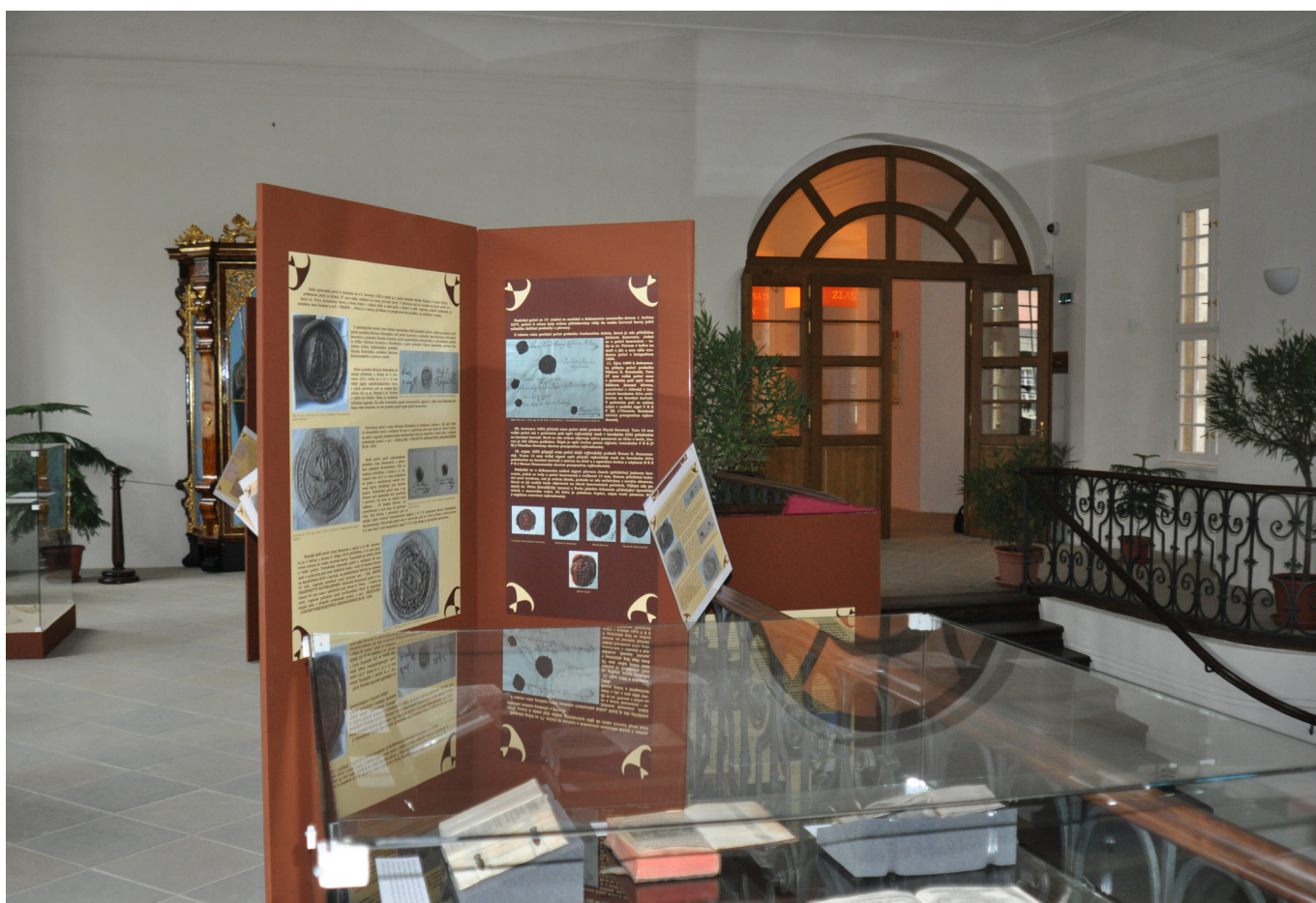
Fotografie z výstavy An vědy a umění miloval ... (Milovníci a mecenáši věd a umění v řeholním rouše), 15. květen – 30. říjen 2014, Benediktinský klášter Rajhrad

Byla realizována výstava „An vědy a umění miloval“ (15. května – 30. října 2014), kterou v prostorách benediktinského kláštera v Rajhradě zhlédlo 9 259 návštěvníků. K výstavě byl připraven cyklus přednášek, 3 koncerty, workshop a dva dny speciálních prohlídek běžně nepřístupných prostor prelatury.