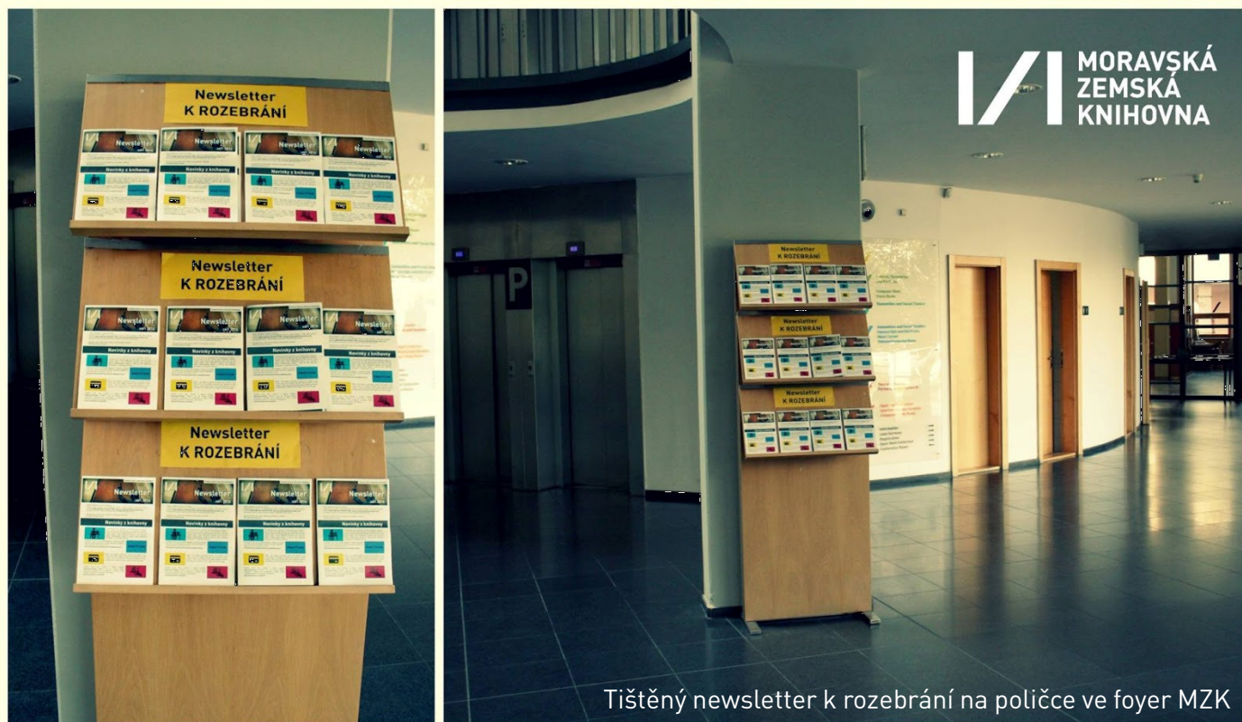
Tištěný newsletter k rozebrání na policiče ve foyer MZK