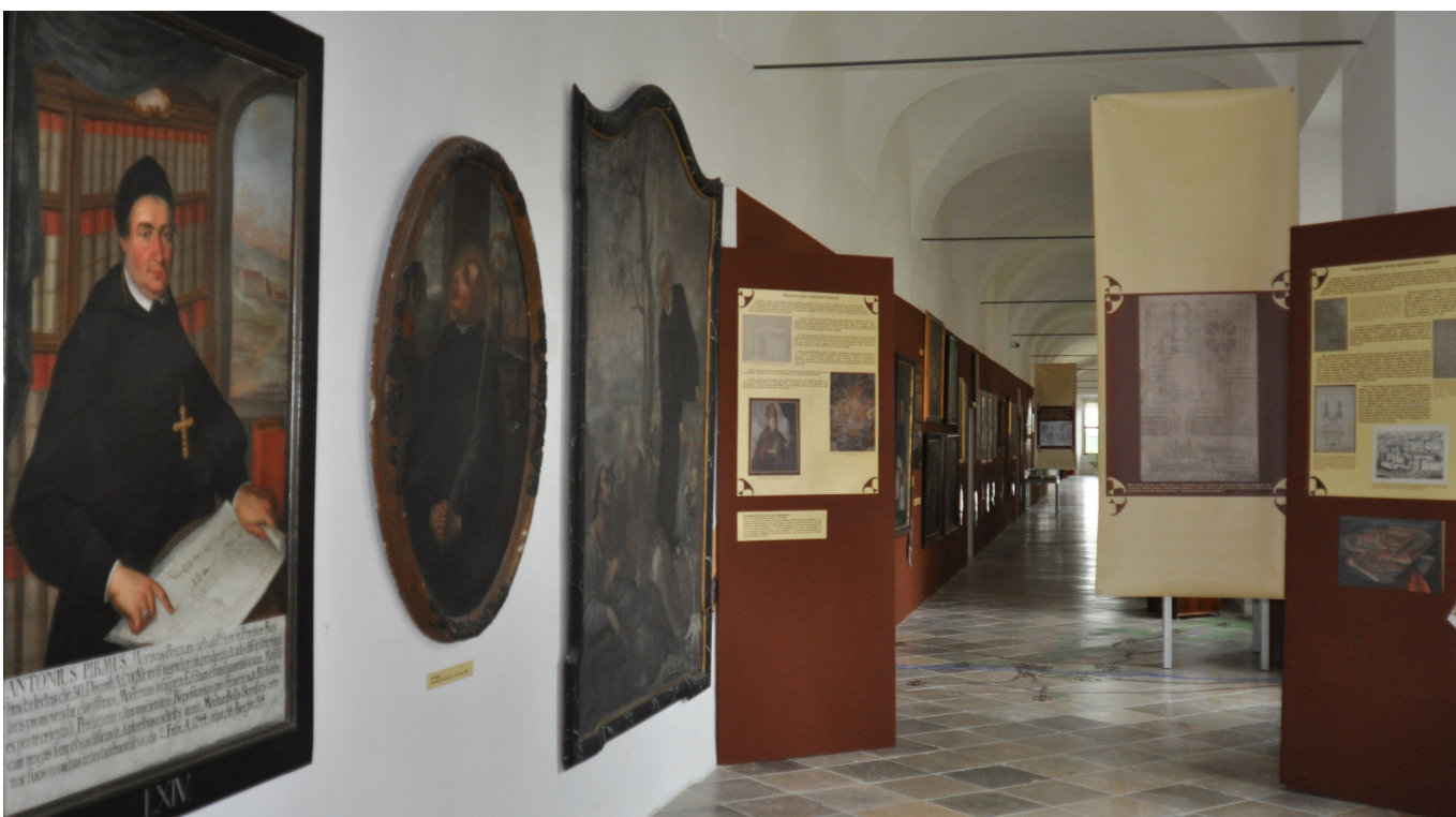
Fotografie z výstavy An vědy a umění miloval ... (Milovníci a mecenáši věd a umění v řeholním rouše), 15. květen – 30. říjen 2014, Benediktinský klášter Rajhrad