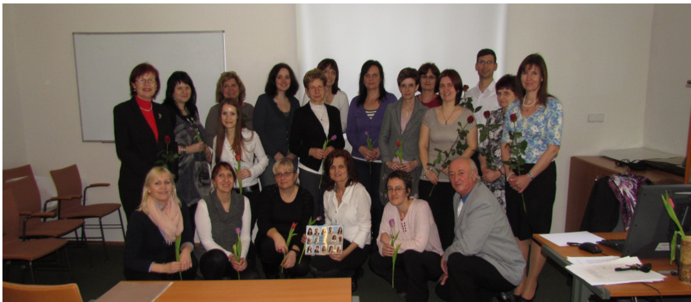
Rekvalifikační knihovnický kurz (akreditovaném MŠMT) absolvovalo celkem 16 účastníků.

V rámci pilotážního projektu UNIV 3 (Národní ústav pro vzdělávání, školské poradenské zařízení a zařízení pro další vzdělávání pedagogických pracovníků) byla MZK pověřena zpracováním zadání pro zkoušku k typové pozici „Knihovník v přímých službách“. Tato pozice je jedním z výstupů pracovní skupiny Národní soustavy kvalifikací (NSK). V roce 2015 bude následovat realizace kurzu a zkoušek této pracovní pozice.